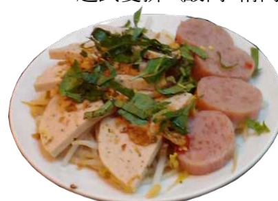
HOT 越式雙拼 (酸肉/精肉團)