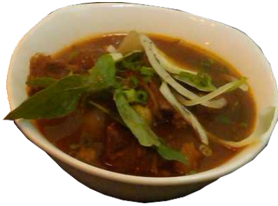
HOT HOT 越式茄汁牛腩飯