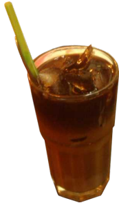
HOT HOT 越南咖啡 (冰)